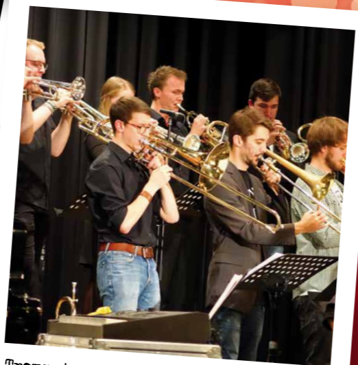
Trompeten- und Posaunen-Section