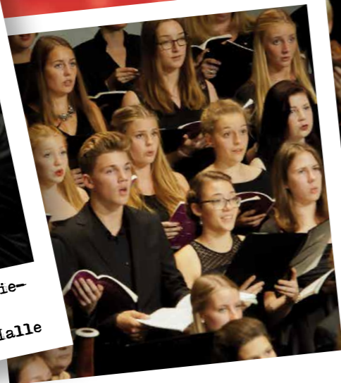
Lobgesang, op. 52 von Felix Mendelssohn-Bartholdy